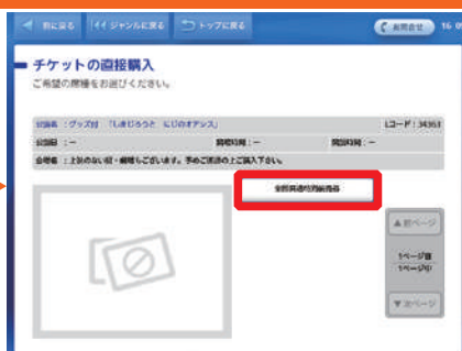
「全国共通鑑賞券」を選択。