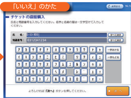
氏名と電話番号を入力。