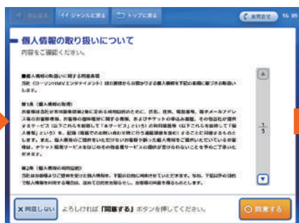
個人情報の取り扱いを確認して、よろしければ「同意する」を選択。