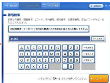
Lコードを入力。※上記は「34363 (2WAY ポシェット引換券つき前売チケット)」の場合。