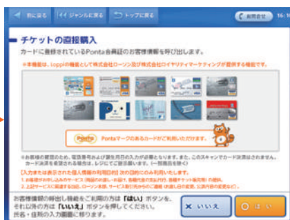
Ponta カードなど表示されている会員証をお持ちのかたは「はい」、お持ちでないかたは「いいえ」を選択。