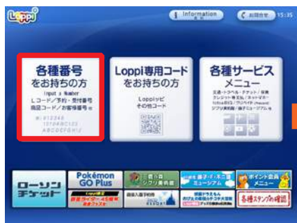
「各種番号をお持ちの方」を選択。