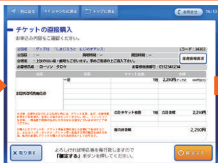
お申し込み内容を確認し、よろしければ「確定する」を選択。