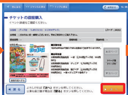
内容を確認後、「次へ」を選択。