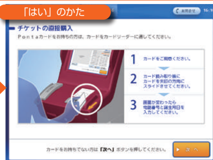
カードを読み取り、電話番号と誕生日を入力。