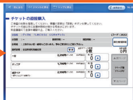
購入希望券種の枚数を選択。